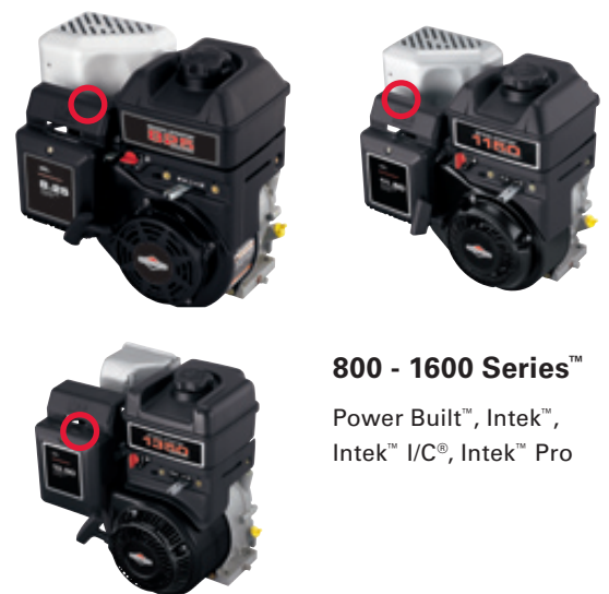
800 - 1600 Series™

Power Built™, Intek™, Intek™ I/C®, Intek™ Pro