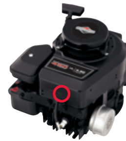
400 Series™, 500 Series™ Classic™, Sprint™, SO™, Q™

○ Auf dem Metallblech über dem Schalldämpfer