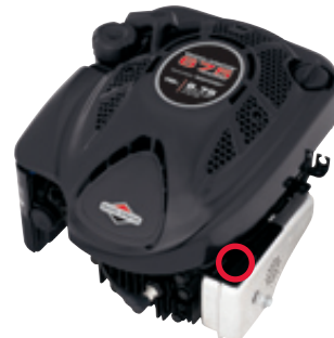
600 Series™, 800 Series™ Quantum®, Intek™