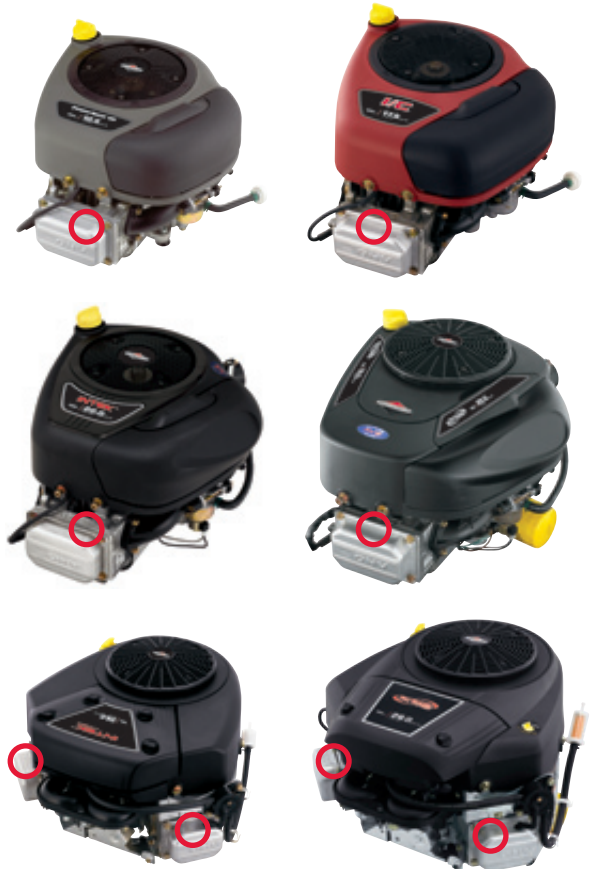
Power Built™ Series, I/C® Series™, Intek™ Series™, Extended Life Series®